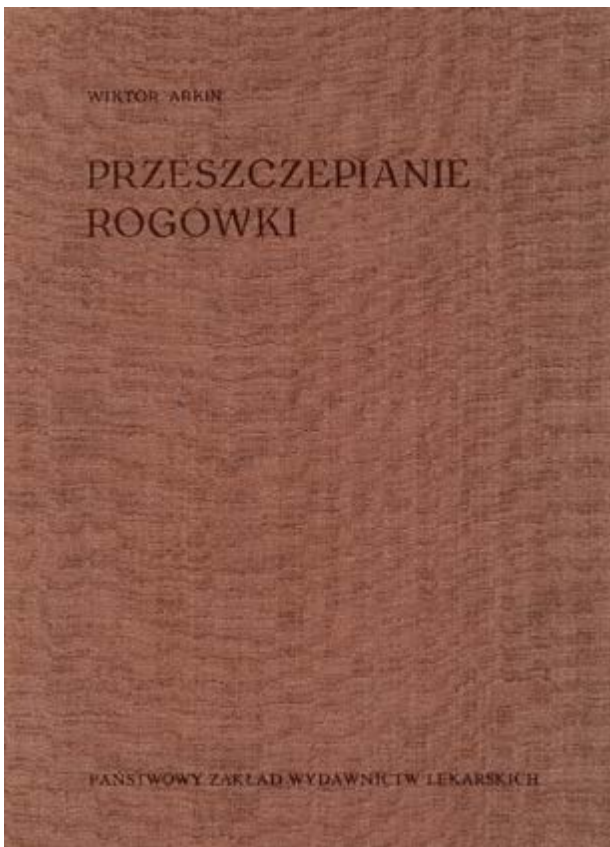
Ryc. 7. Strona tytułowa.

ku, a więc operację zaćmy, daleko posuniętej jaskry, odklejonej siatkówki”. Do względnych przeciwwskazań zaliczył autor m.in. względy społeczne, czyli kiepskie warunki higieniczne w domu, brak opieki w domu, etc. Do zabiegów wykonywanych ambulatoryjnie Arkin zaliczył zabiegi dotyczące powiek i spojówki, ale co ciekawe także niektóre zabiegi oczodołowe, usunięcie gałki ocznej oraz operacje zeza. Autor podał, że ówczesnie w Ambulatorium Kasy Chorych w Warszawie wykonywano ok. 500 operacji ambulatoryjnych. W pracy pt. O zaletach i wadach niektórych sposobów operowania zaćmy z 1935 roku Arkin przedstawił zalety i wady operacji zewnątrztorbkowej i wewnątrztorbkowej zaćmy oraz omówił różne techniki dotyczące tej drugiej metody. [17] W pracy pt. O powstaniu i roli przedarc w odwarstwieniu siatkówki z 1948 roku omówił rolę przedarc w etiopatogenezie odwarstwienia siatkówki oraz znaczenie ich zaopatrzenia dla skuteczności operacji. [18]