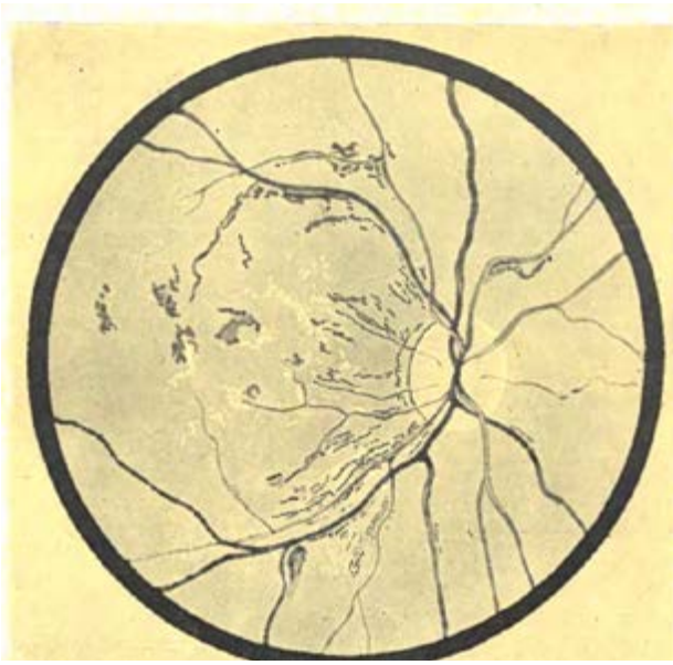
Ryc. 6. Retinopatia cukrzycowa. Źródło: Arkin W. O powikłaniach ocznych w cukrzycy . w: Postępy Okulistyki . T.III. Warszawa 1956: 48-64.