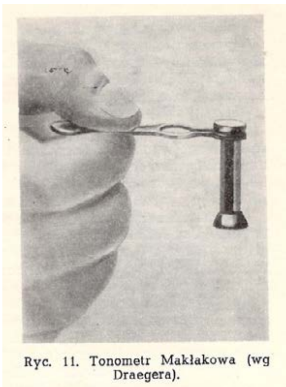
Ryc. 11. Tonometr Maklakowa (wg Draegera).