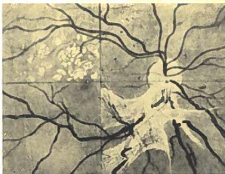
Ryc. 1. Schemat dna oka w cukrzycy. Górny prawy prostokąt: mikroaneuryzmaty; górny lewy prostokąt: żółtawobiaławe ogniska; dolny lewy prostokąt: rozstrzenie żyłne; dolny prawy prostokąt: nowotworstwo tkanki łącznej i naczyń (wg Goodmana).

„Na pierwszy rzut oka zadawałoby się, że każda operacja oczna może być wykonywana ambulatoryjnie. Przytłaczająca większość zabiegów ocznych dokonywuje się w znieczuleniu miejscowym, przy użyciu tak małych środków narkotycznych, że ich ogólne działanie jest nieznaczne. Zabiegi są krótkotrwałe i na ogół mało bolesne, operacje na samej gałce może nawet mniej bolesne niż inne. Cięcia przy zabiegach są tak małe, że nie grożą poważnie większym krwotokiem”. [16] Opis ten mógłby śmiało pochodzić z XXI wieku. Jednak już szczegółowe omówienie wskazań i przeciwwskazań do zabiegów ambulatoryjnych różni się zasadniczo od praktyki współczesnej. Do bezwzględnych przeciwwskazań zaliczył zabiegi wymagające narkozy oraz zabiegi, po których „chorych bezwzględnie powinien pozostawać w łóż-